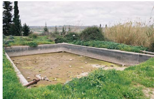
Η Δεξαμενή του Χωριού

Το Βρυσί, Του Τόφα Το Τσιουβλίτσι Η Κουτσάτζιενη Το Δοξαμενού Του Χαραλαμπή Της Αούστας Των Πανάων Ο Τζιοίλικας Του Χρύσανθου Ο Παλιόμυλος Οι Λάκκοι Η Περβόλα Του Αλουπού Δίπλα από το σπίτι του Θεούλα Του Χτζηδαμιανού Του Χατζηγιωρκαλλή Του Μυλόρτου Του Χωρκού (η Φουντάνα και το Λαούμι) Δίπλα από το σπίτι του Κυριάκου της Χατζηπραξούς Δίπλα από το σπίτι του Πέσολωμου Ο Δράκος Το Βασιλικό Ο Τζιελεφός Του Πασκάλη Της Αμαξώστρατας Του Χατζηνικόλα (η Καννούρα) Του Καμπούρη (η Βραστούα)