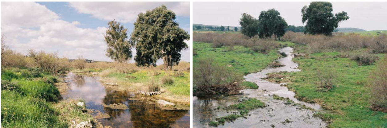
Ο Οβγός ποταμός

δε στα νερά του Οβγού ποταμού, λόγω της ολόχρονης τότε ροής του, οι βοσκοί έλουαν τα πρόβατά τους, ενώ οι γεωργοί της γύρω περιοχής συνήθιζαν να καθαρίζουν και να επεξεργάζονται διάφορα γεωργικά προϊόντα, ειδικότερα το λινάρι, που σημειώνεται ότι αφθονούσε παλαιότερα στην περιοχή. Ο Βροχός και το Δίμμα της Ζωδκιάτισσας είναι τοπωνύμια περιοχών της Φιλιάς, αλλά και σημεία του ποταμού Οβγού, όπου οι Φιλιώτες γεωργοί, αλλά και γεωργοί από άλλα γειτονικά χωριά, όπως Ζωδιάτες, Κατωκοπίτες και Μασαριώτες συνήθιζαν να επεξεργάζονται το λινάρι. Είναι σημαντικό να αναφερθεί ότι ο Οβγός ποταμός, εκτός από το πολύτιμο νερό του, ήταν επίσης πλούσιος σε καλαμιώνες, “βλούι” και “σκλινίτζια”, προϊόντα που επεξεργάζονταν και αξιοποιούσαν οι αγρότες για την κατασκευή οικοδομικών υλικών, όπως ψαθαριών, καθώς και στην καλαθοπλαστική και καρεκλοποιεία.