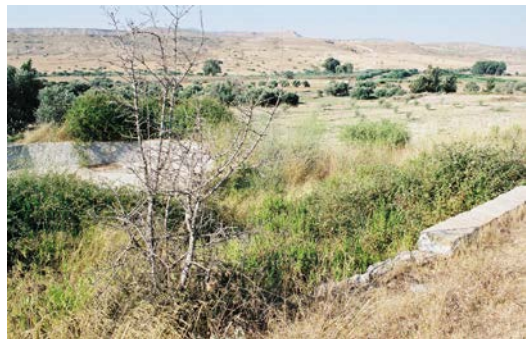
Η Δεξαμενή του Τζιοίλικα