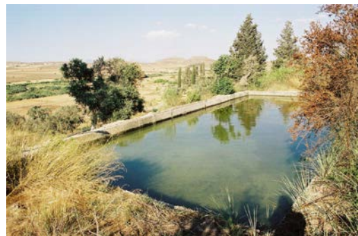
Η Δεξαμενή του Πανάου

Το νερό όσων από τις φυσικές αυτές πηγές βρίσκονταν γύρω και μέσα στο χωριό χρησιμοποιείτο επίσης και για οικιστικούς σκοπούς. Συνήθως κατά τα πρωινά και τα απογεύματα οι γυναίκες πήγαιναν στη βρύση με τις στάμνες, τις κούζες, τις κουκουμάρες και άλλα δοχεία για να μεταφέρουν νερό στο σπίτι και να γεμίσουν τα πιθάρια για να το χρησιμοποιήσουν στη συνέχεια ως πόσιμο και για τις άλλες ανάγκες του σπιτιού. Άλλες πάλιν οικογένειες είχαν δικό τους λάκκο στο σπίτι και με τα αλακάτια έφερναν το νερό στην επιφάνεια και το χρησιμοποιούσαν ως πόσιμο, καθώς και για τις άλλες οικιακές τους ανάγκες.