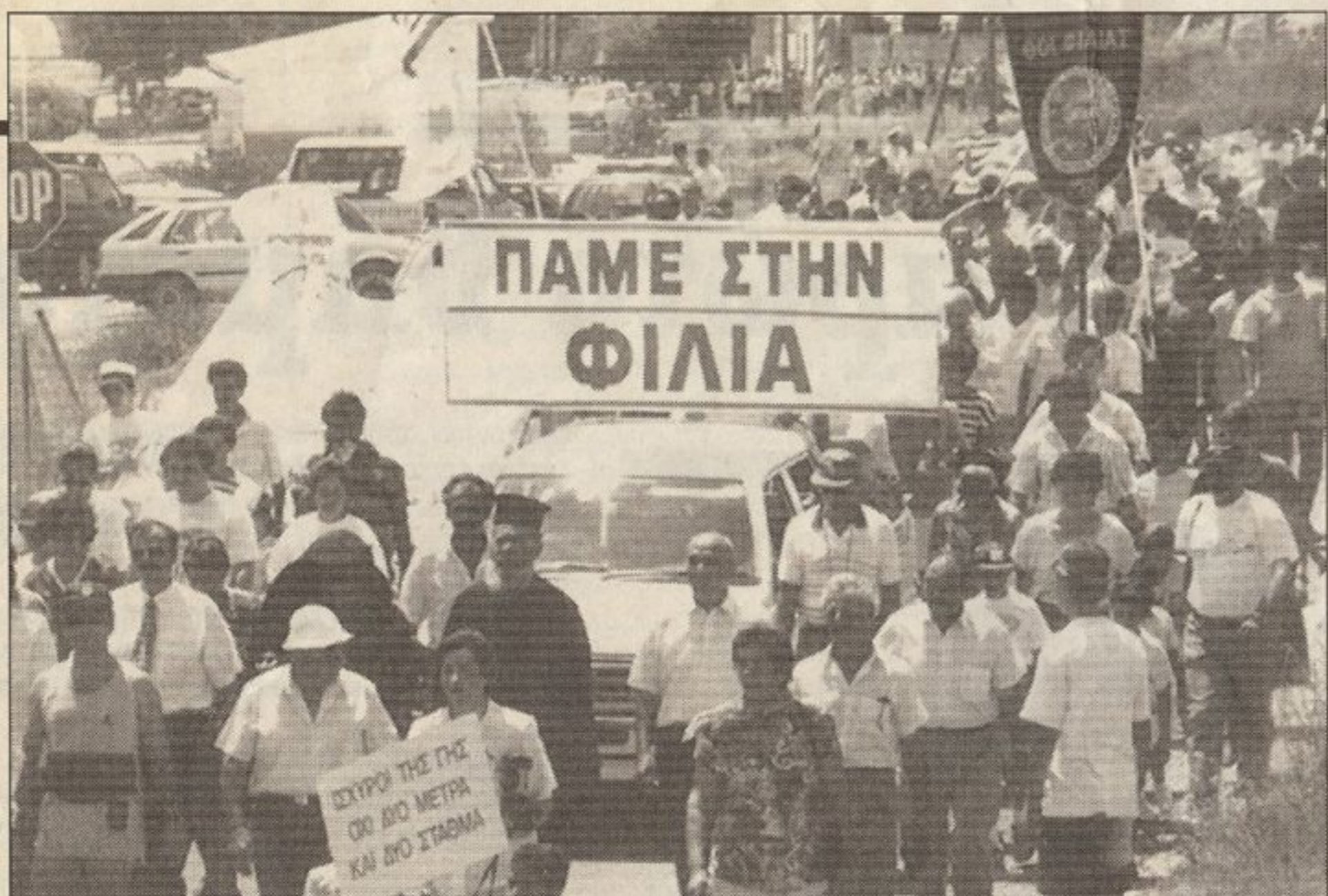
«Πάμε στη Φιλιά», το σύνθημα που παρολίγον να γίνει πραγματικότητα.