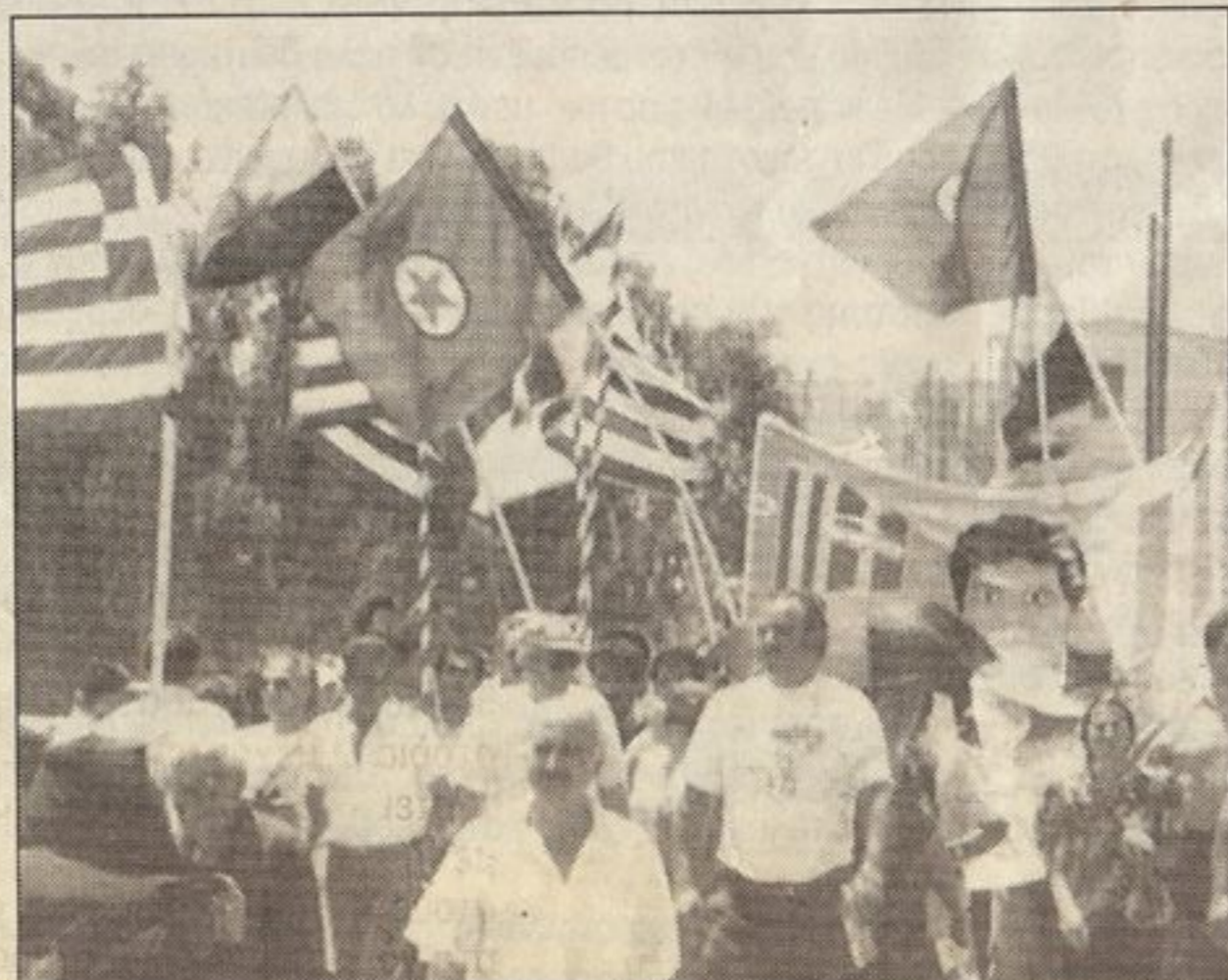
Η Κουρδική συμμετοχή. Με τη φωτογραφία του Θεόφιλου μπροστά.

Κοντά στους Φιλιώτες στάθηκε ένα ακόμα κομμάτι λαού που στενάζει κάτω από τη βάρβαρη τουρκική κατοχή: οι Κούρδοι! Μικρή ομάδα Κούρδων, με σημαίες του Κουρδιστάν και του Εργατικού Κόμματος που αγωνίζεται ενάντια στην τουρκική κατοχή, έλαβε μέρος στην πορεία των Φιλιωτών. Τη δική τους συμμετοχή τόνιζε ένα μεγάλο πανό στο οποίο ήταν ζωγραφισμένη η φωτογραφία του αγωνιστή Θεόφιλου Γεωργιάδη ο οποίος δολοφονήθηκε από πράκτορες των Τούρκων, πλαισιούμενη από την Ελληνική σημαία και τη σημαία του Κουρδιστάν.