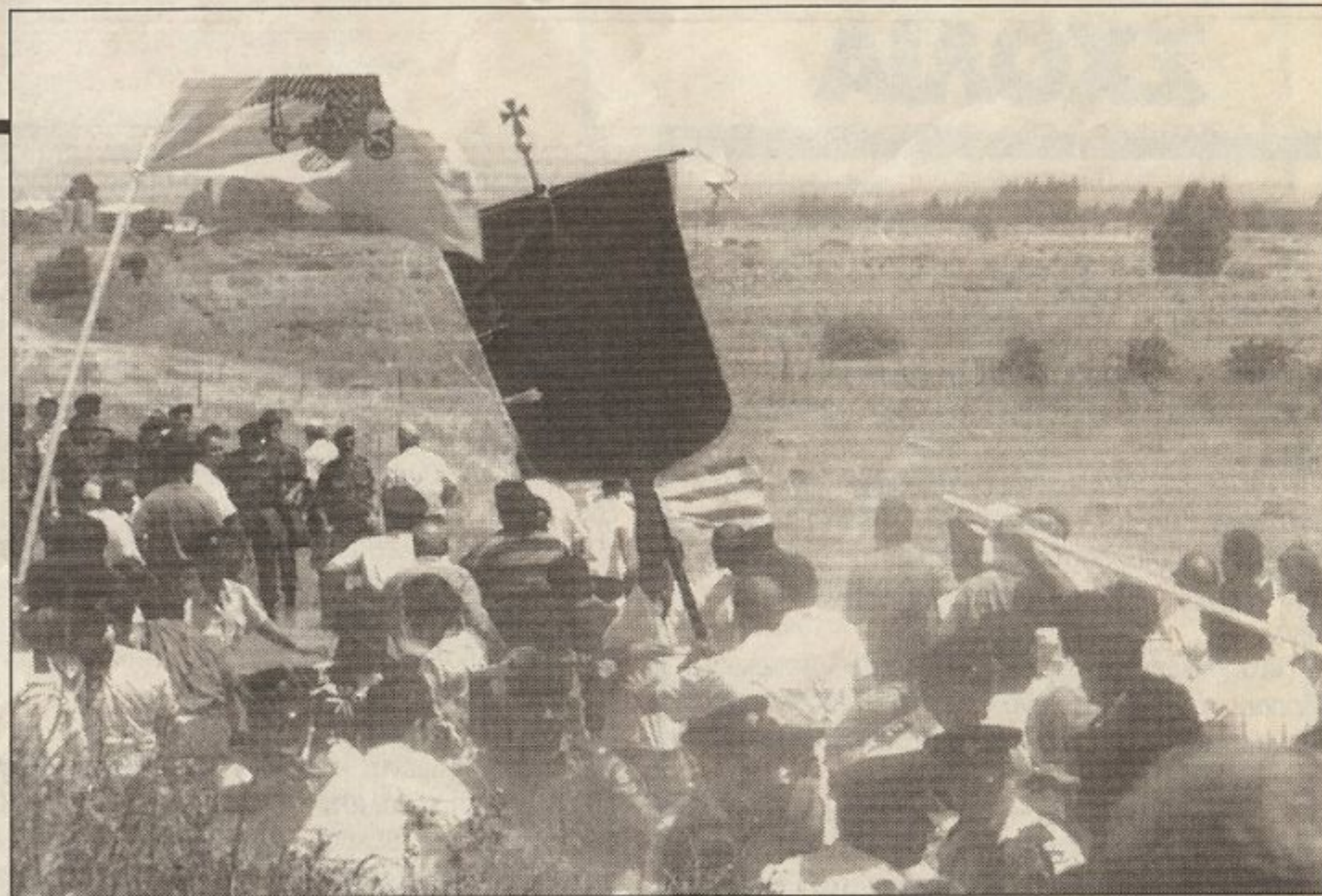
Ο πρώτος κλοιός σπάει. Πίσω η ΜΜΑΔ.