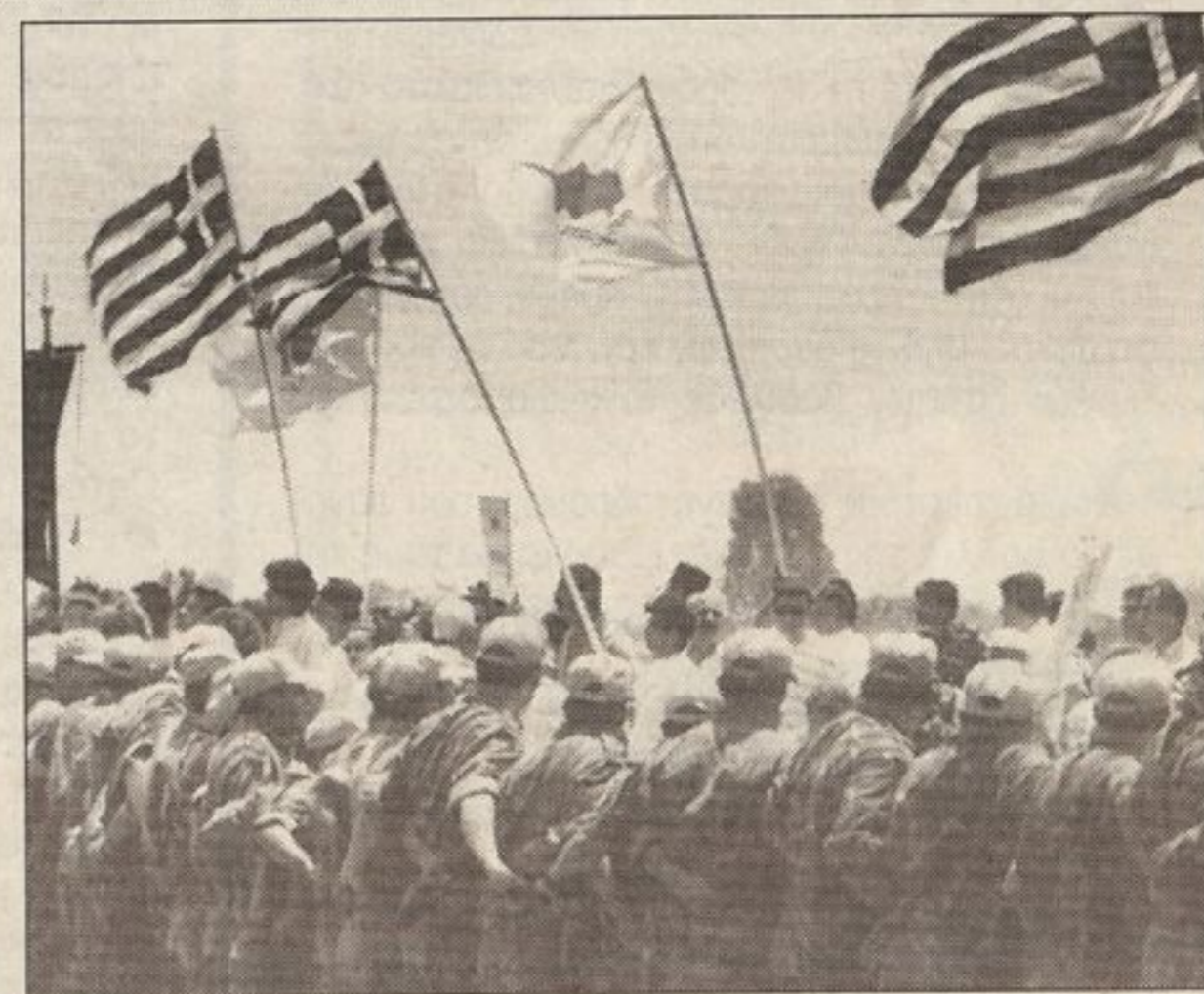
Ισχυρός κλοιός Αργεντινών ειρηνευτών. Η συμπεριφορά τους ήταν άψογη.

Σε αντίθεση με παλαιότερες πορείες Ελληνοκυπρίων όπου οι άνδρες της ΟΥΝΦΙΚΥΠ αποκάλυπταν τον κακό τους εαυτό, η δύναμη Αργεντινών Ειρηνευτών που κάλυπτε χθες το χώρο της πορείας των Φιλιωτών υπήρξε άψογη στη συμπεριφορά και αρκετά συνεργάσιμη. Χωρίς να προκαλούν τους διαδηλωτές όπως συχνά κάνουν ειρηνευτές άλλων εθνικοτήτων, και με τρόπο ευγενικό και πραγματικά άψογο, έκαναν τη δουλειά τους και πέτυχαν τη συνεργασία όσων συμμετείχαν στην πορεία.